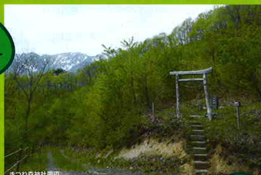
きつね森神社周辺

春の山菜～夏の沢～秋のきのこ～冬の雪遊びまで、鬼首の「きつね森」は体験学習の森です。