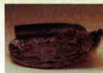
漆パレットと漆紙文書