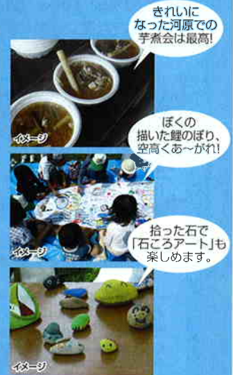
きれいに なった河原での 芋煮会は最高!