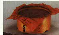
漆容器とフタ紙(複製)

フタ紙として利用された紙の多くは、公文書を再利用したため、貴重な歴史を多く伝えてくれます。さらに、紙の両面利用→漆容器のフタ紙利用というリサイクルをよみとることができます。当時紙は貴重なものであったため再利用に努めたのかもしれませんが、地球環境が危ぶまれる今日においては、このような意識を見習ってみたいものです。