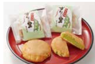
滑らかな餡子が絶品 御菓子処モリヤのずんだの里