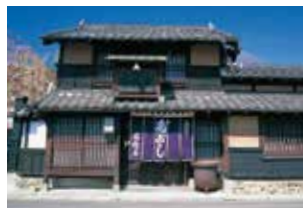
江戸時代の雰囲気を残す仙臺菓子屋 石橋屋