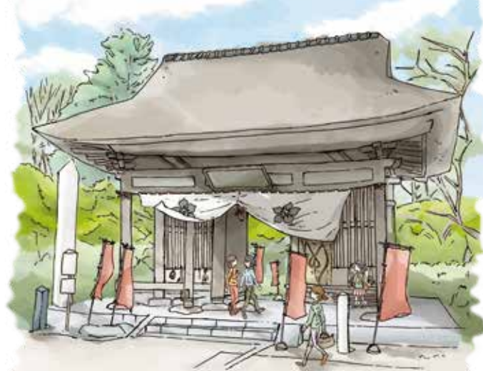
陸奥国分寺 薬師堂