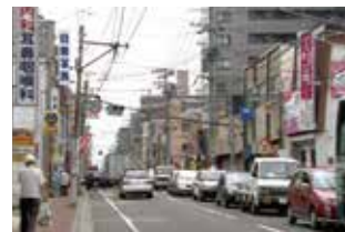
人情味あふれる店が集まる 荒町商店街