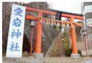
仙台市内を一望できる絶景スポット 愛宕神社