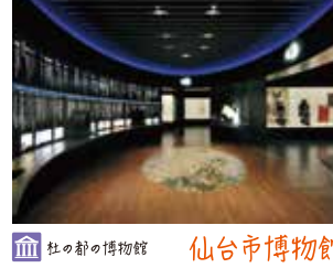
社の都の博物館 仙台市博物館