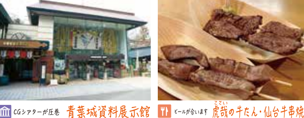
CGシアターが圧巻 青葉城資料展示館