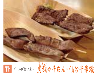
ビールが合います 虎哉の牛たん・仙台牛串焼き