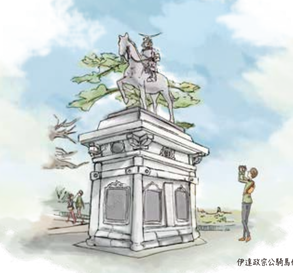
伊達政宗公騎馬像