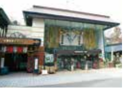
青葉城資料展示館 E-4

政宗公の一生を始め伊達家・仙台藩・仙名城(青葉城)に関する実物資料、パネル、模型などを展示しており、迫力のCGシアターが好評です。