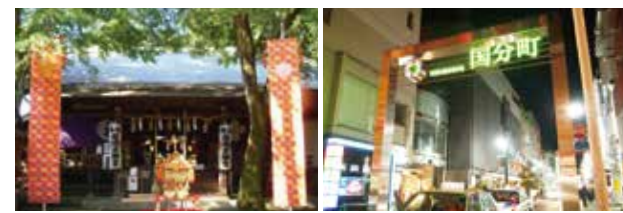
十六社の御祭神を祀る 櫻岡大神宮 東北唯一の飲食街 国分町通