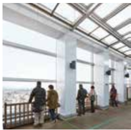
② AER展望テラス C-8

AER最上階37階の無料で利用できる展望スペース。昼と夜とそれぞれ違った表情を見せ、観光客はもちろん、地元の人にも人気のスポットです。