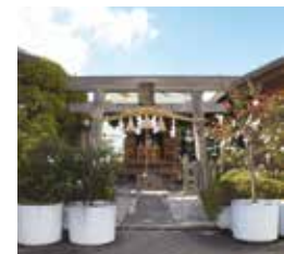
⑤ えびす神社 D-5

AER最上階37階の無料で利用できる展望スペース。昼と夜とそれぞれ違った表情を見せ、観光客はもちろん、地元の人にも人気のスポットです。