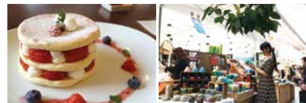
大人なカフェ カフェ・クオーネ おいしい出会いのある市場 伊達美味マーケット