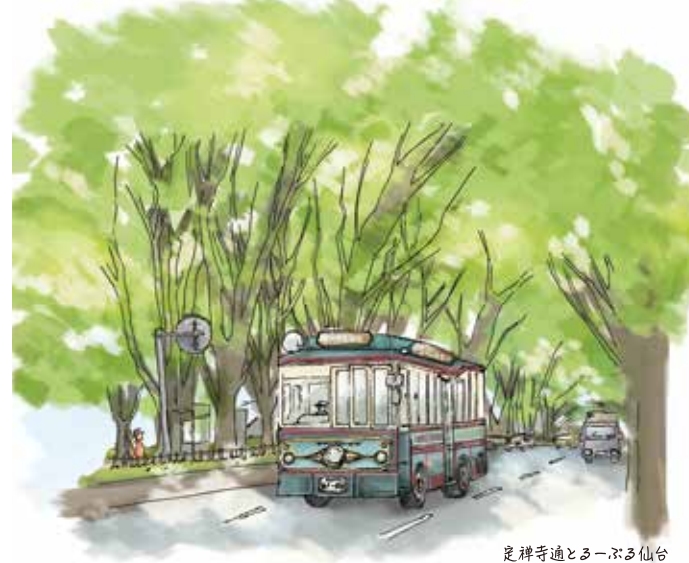
定禅寺通とるーぶる仙台