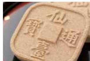
通貨を模した縁起菓子 熊谷屋の仙台鉄銭