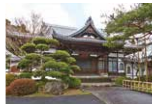
伊達朝宗公の菩提寺にして北山五山の一角 満勝寺