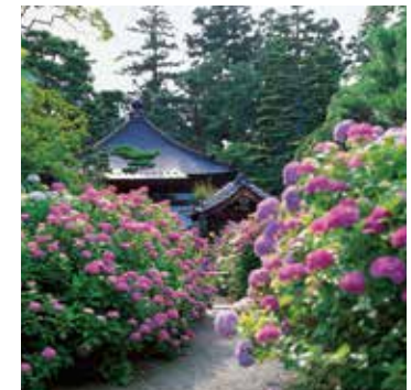
⑤ 資福寺のあじさい [B-4]

東北有数の名園として知られ、仙台市内外から多くの人々が訪れます。四季の営みと溶け合いながら、深い安らぎを与えてくれます。