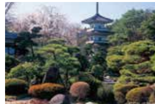
東北有数の名園 輪王寺の禅庭園