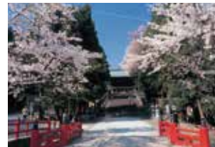
二代藩主伊達忠宗公が建てた 東照宮