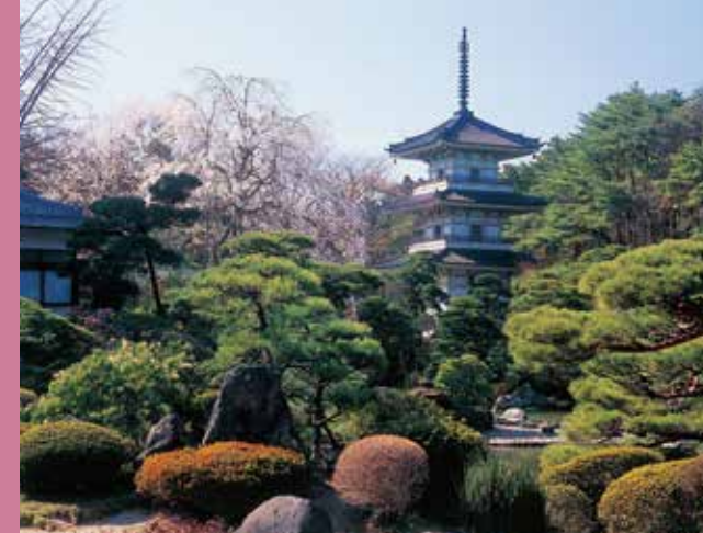
⑥ 輪王寺の禅庭園 [B-3]

東北有数の名園として知られ、仙台市内外から多くの人々が訪れます。四季の営みと溶け合いながら、深い安らぎを与えてくれます。